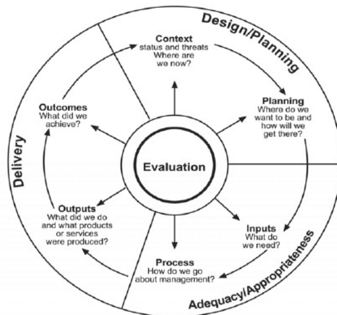
Joonis 1. Kaitseala kaitsekorralduse ja selle tulemus-hindamise tsüklil nn WCPA metoodilise raamistiku tähenduses

Käesoleva meetodika algversioon valmis detsembris 2009, praegune on täpsustatud ja edasi arendatud Keskkonnaameti tagasiside alusel, sealhulgas Viidumäel läbiviidud testimise ja sellele samas 28. aprillil 2010 järgnenud metoodilise seminari tulemuste põhjal.