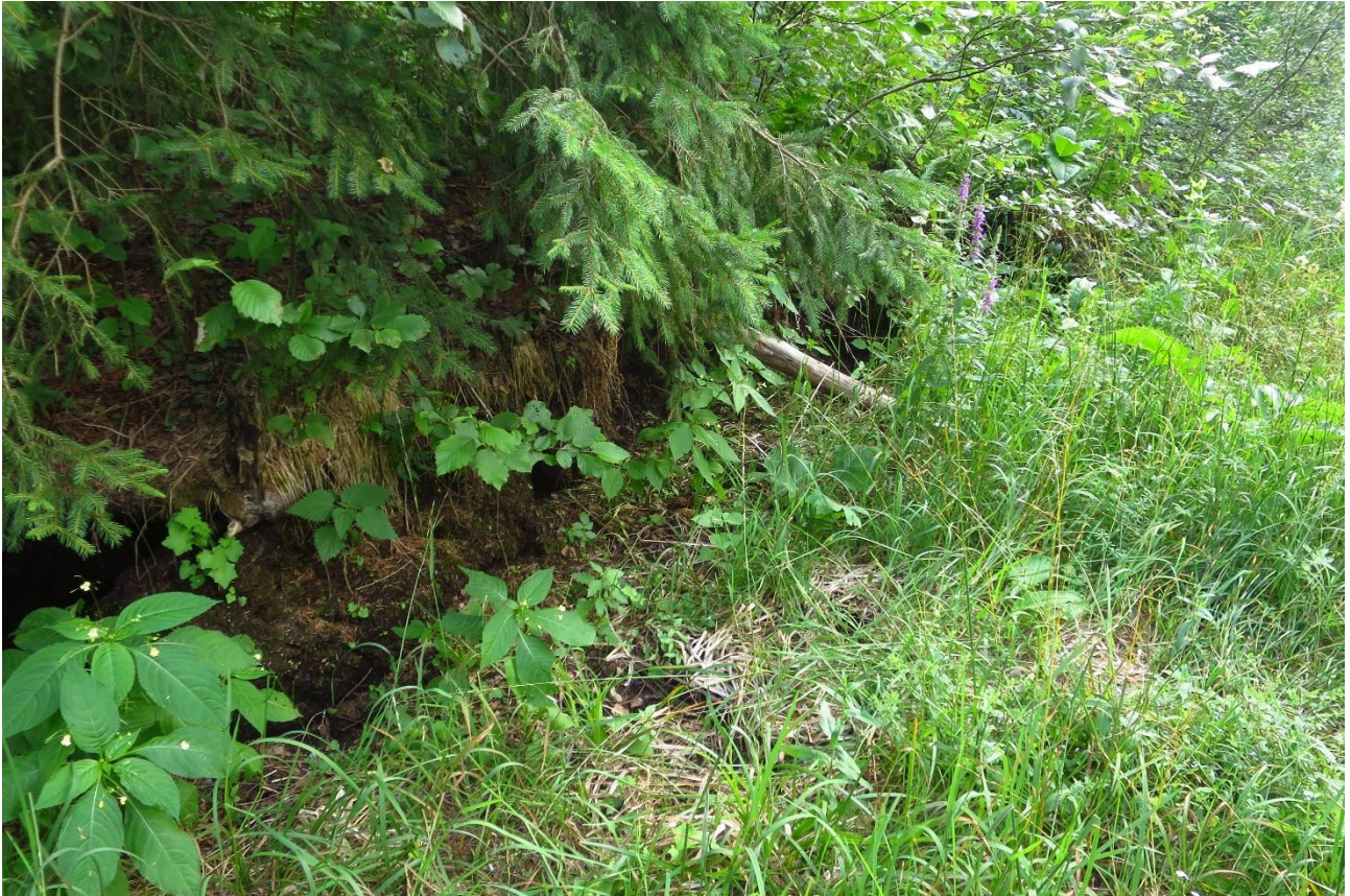
2. Vete ristumiskoht. Edelasse minev haru oli mudane, aga vett polnud. Peavool oli lõunast ehk Räbi järve suunast põhja poole. Mõrtsuka järve poolt vett ei voolanud, oli vaid veidi seisvat vett: