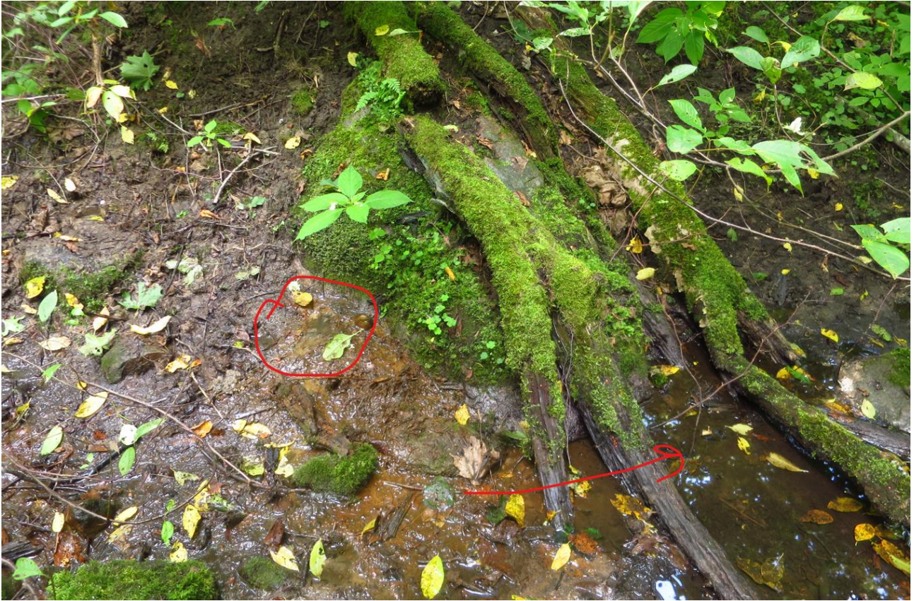
10. Nirises väike ojake: