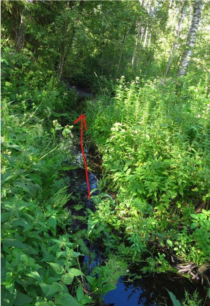
3. Vana koparapais, millest edela pool oli paarikümne meetri pikkuselt väheke seisvat vett. Kirde pool oli vaid mudane säng: