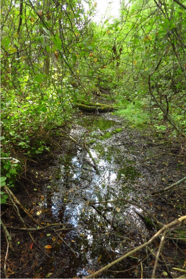
4. Oja säng oli kuiv: