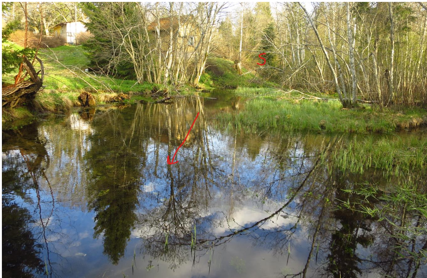
2. Kõige põhjapoolsem Krei tõusuallikas: