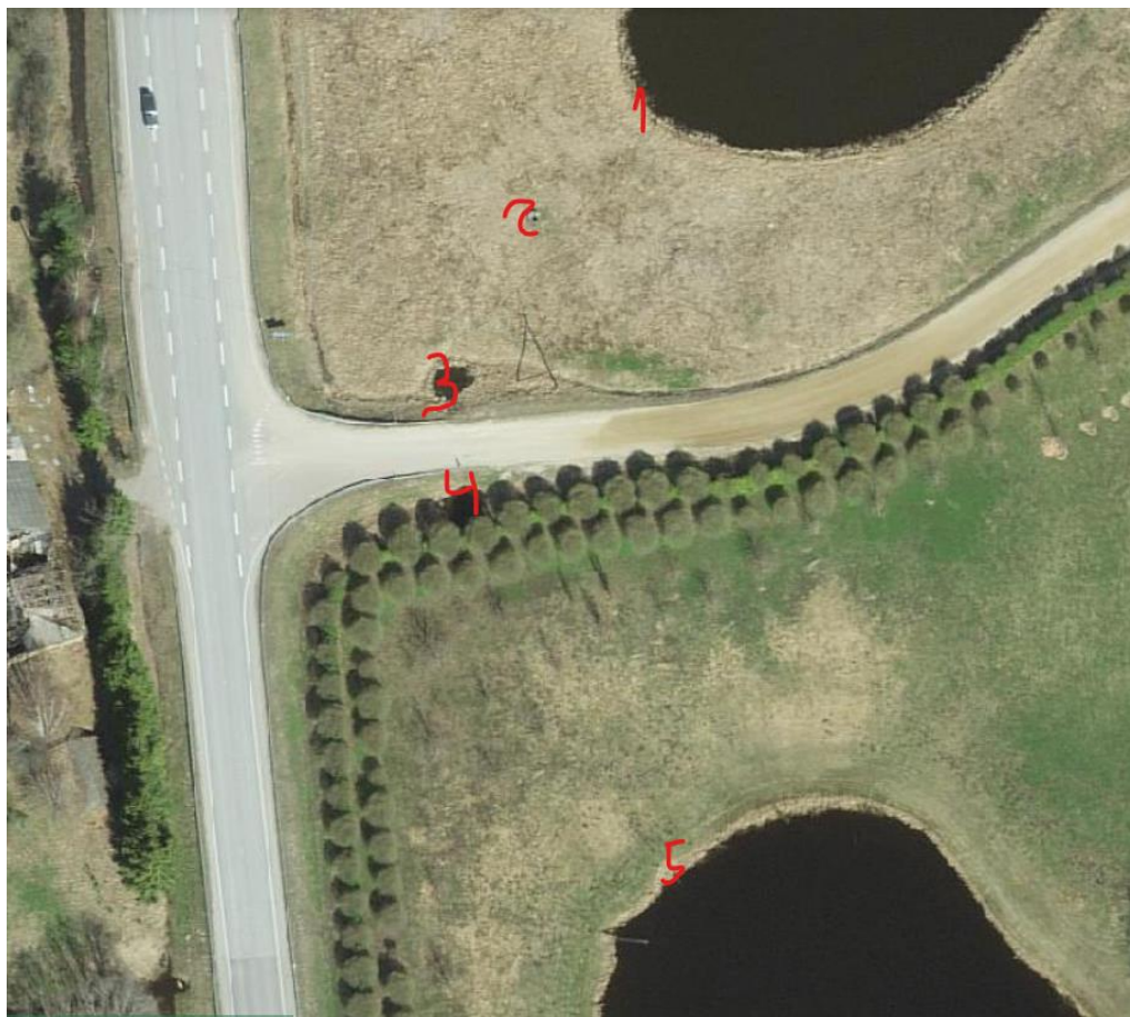
1. Järvest toimub väljavool edelasopis. Seal on suur üleni vee all olev toru: