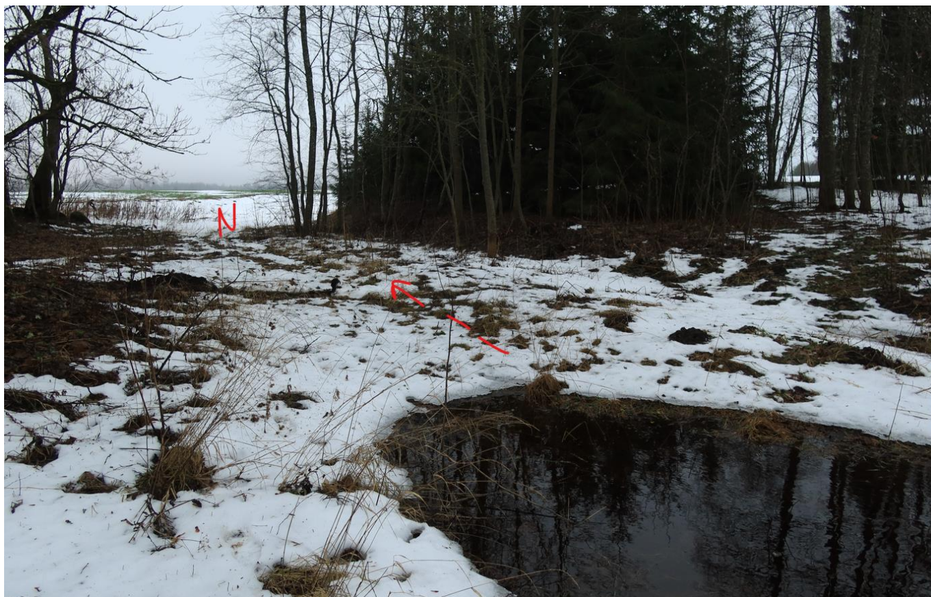
8. Vaade lõunasse. Kihu ja Virulase talu vahel olev sopp oli vett täis. Vesi oli ka vaatluspunktist läände jäävas umborus