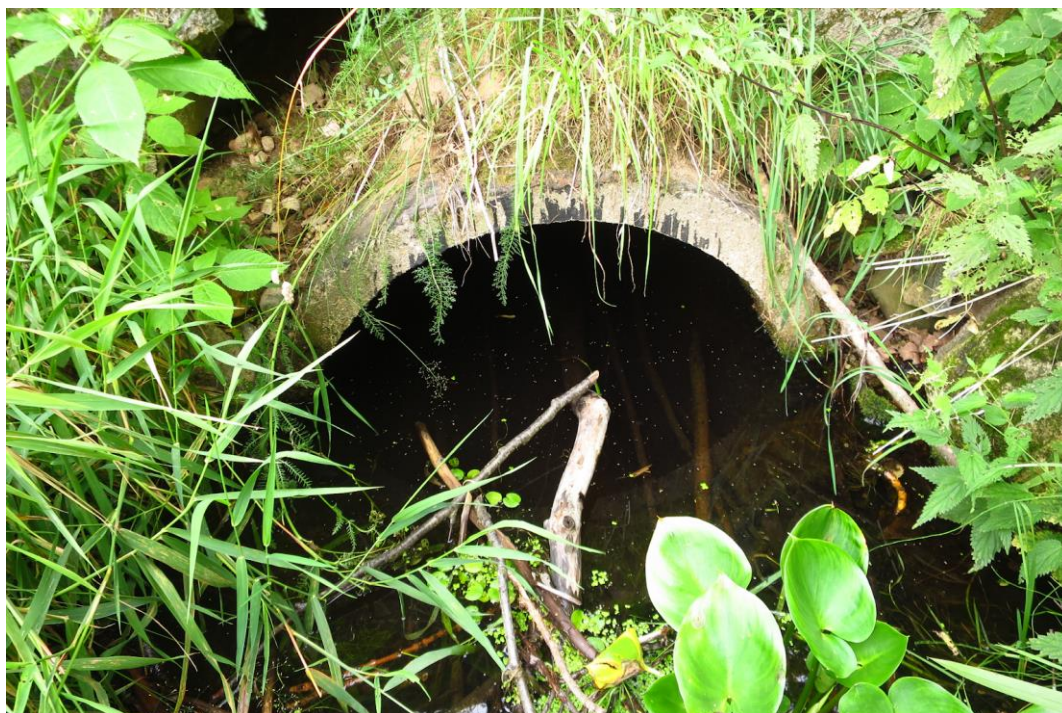
Järv püsib Vahtõsõnõ järve üleval hoidva Verioramõisa paisu tõttu. Selle paisutusala ulatub truubini kui ka sellest ülesvoolu: