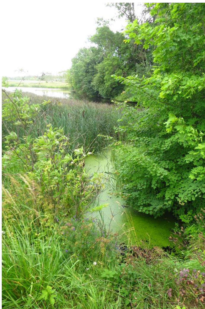
Vahtsõnõ järve ruumikuju võiks ETAKis kuni truubini pikendada, sest tegelikult ulatub järv sinnani.