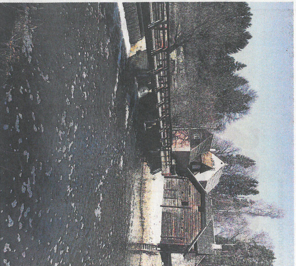
Tulevikus saavad kalad Peedu veski paisust mööda ujuda.