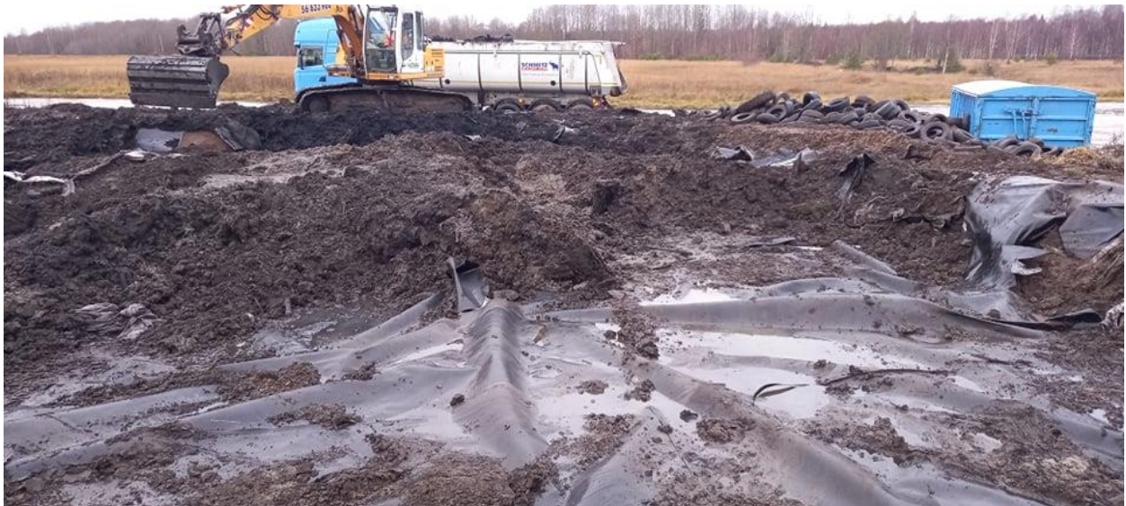
Pilt 2. Reostunud pinnase alt välja tulnud geomembraan