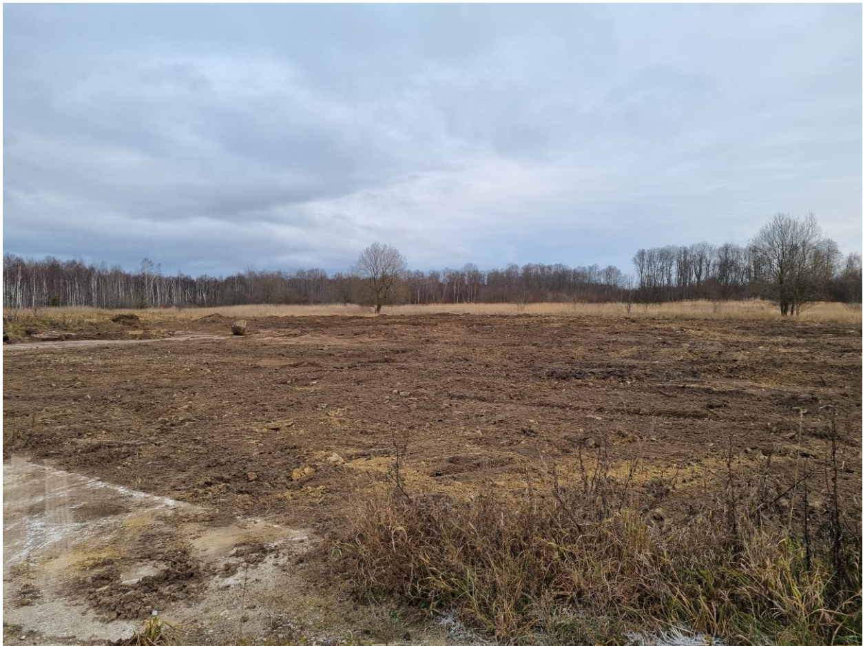
Pilt 4. Ala peale silumist ja tasandamist.