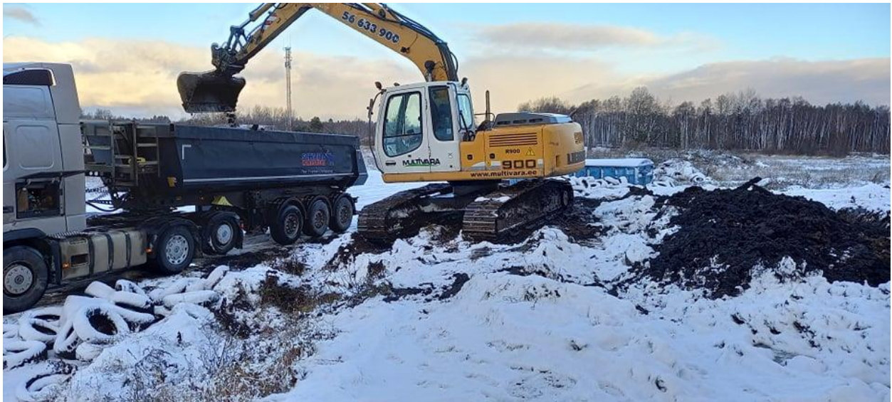
Pilt 1. Reostunud pinnase laadmine autodele ja transport AS Epler & Lorenz