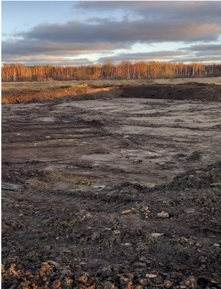
Pilt 3. Ala peale reostunud pinnase äraviimist