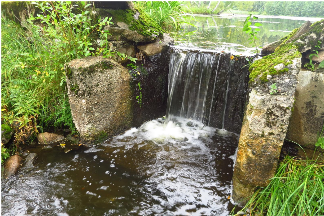
Oja alaveepoolsed kaldad on kindlustatud maakividega: