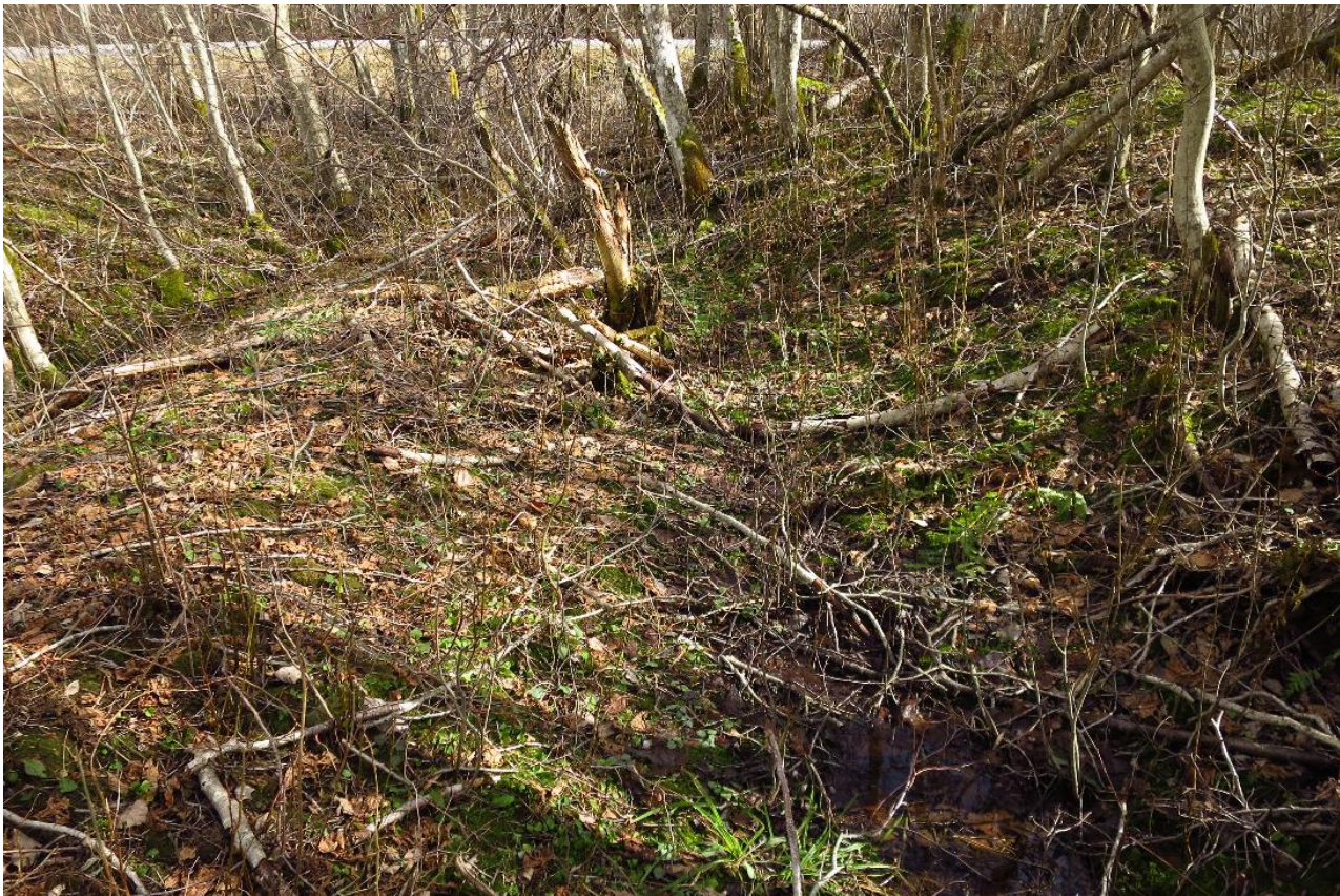
3. Siin on kraav uuesti täiesti kuiv, sõnajalad kasvavad ka sees, mis näitab, et seal ei ole kunagi vett.